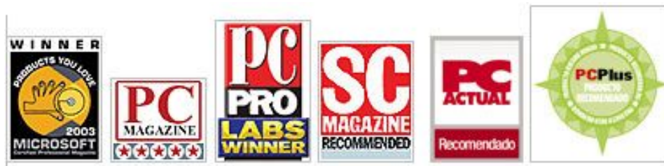
Algunos premios obtenidos por NetSupport DNA